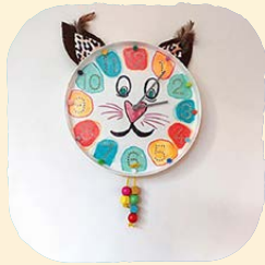
meiden op vrijdag